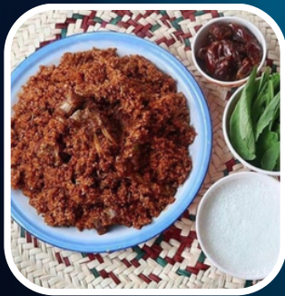
A unique dining experience