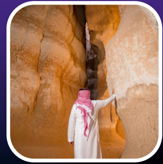
free entry For all facilities