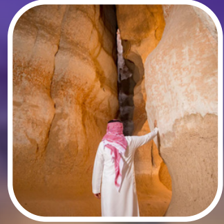
دخول مجاني لجميع المرافق