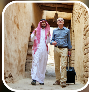
مرشد سياحي مرافق